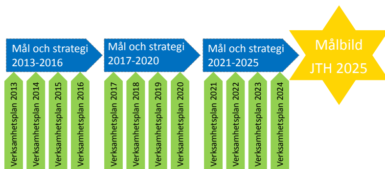
Figur 2 Systematiskt arbete med hjälp av Verksamhetsplaner och Mål och strategi-dokument för att nå målet JTH 2025