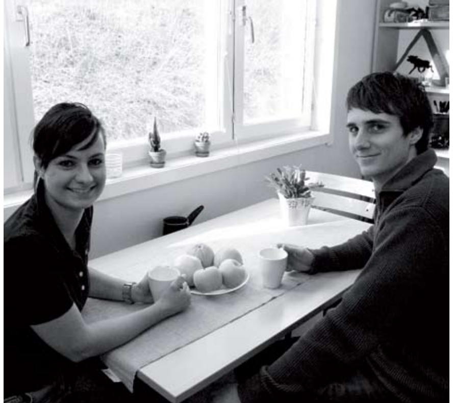
Internationella studenter i ett studentrum på Gräshagen.

DIRECTOR OF INTERNATIONAL RELATIONS AND RECRUITMENT, JIBS